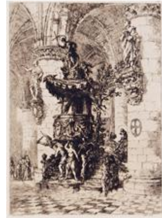
BRUSSELS St. Gudule: Carved Pulpit