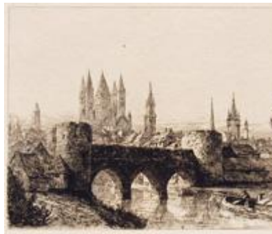
TOURNAI Ancient Bridge and City Wall PLATE XII