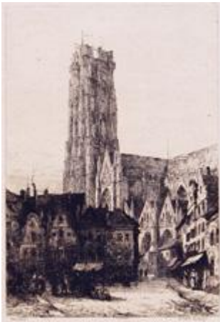
MALINES St. Rombold