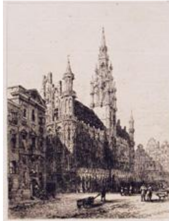
BRUSSELS Hôtel de Ville and Grande Place