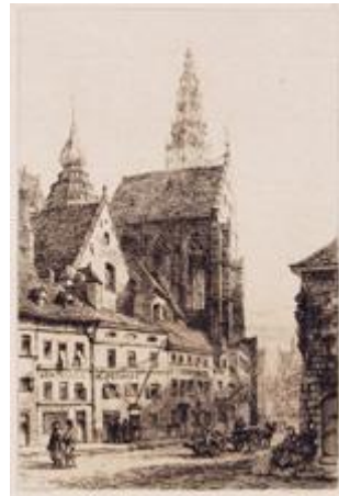
ANTWERP The Cathedral of Notre Dame