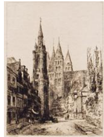
TOURNAI The Cathedral and Belfry PLATE XIII