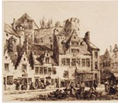
GHENT Castle of Ghent PLATE VIII