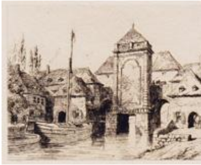
TOURNAI Bridge and Water-Gate