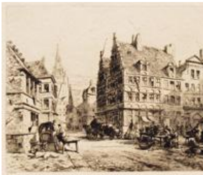
GHENT Old Houses in the Place St. Pharaïlde PLATE X