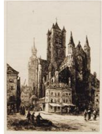
GHENT St. Nicholas and the Belfry PLATE IX