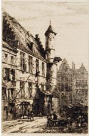
GHENT House of Alva PLATE VII